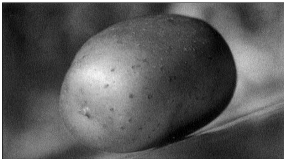
MATERIÁLNĚ ZALOŽENÝ ČLOVĚK MILUJE PODLE MAZDAZKANU PŘEDEVŠÍM PLODY, KTERÉ ROSTOU POD ZEMÍ A JSOU BARVY ČERVENÉ A HNĚDÉ - MEZI TAKOVÉ POTRAVINY PATŘÍ NAPŘÍKLAD BRAMBORY.

Materiálně založený člověk miluje podle mazdazkanu především ovoce a plody, které rostou pod zemí a jsou barvy červené a hnědé (mezi takové potraviny patří např. různé tropické a subtropické ovoce, mrkev, brambory či cibule). Základem jeho stravy by měly být polévky, kaše, zapéčená zelenina, saláty, měl by konzumovat hodně mléčných produktů.